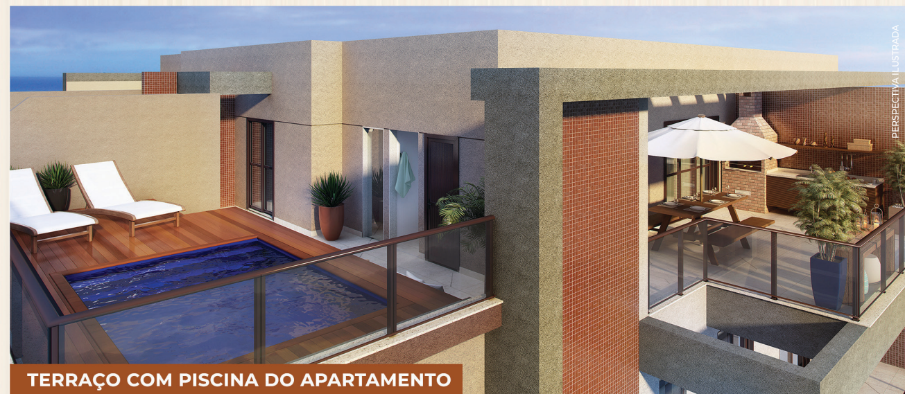
TERRAÇO COM PISCINA DO APARTAMENTO

*PISCINA, DECK E CHURRASQUEIRA ENTREGUES APENAS PARA CLIENTES QUE ADQUIRIRAM NO PROGRAMA TEGRA ID.