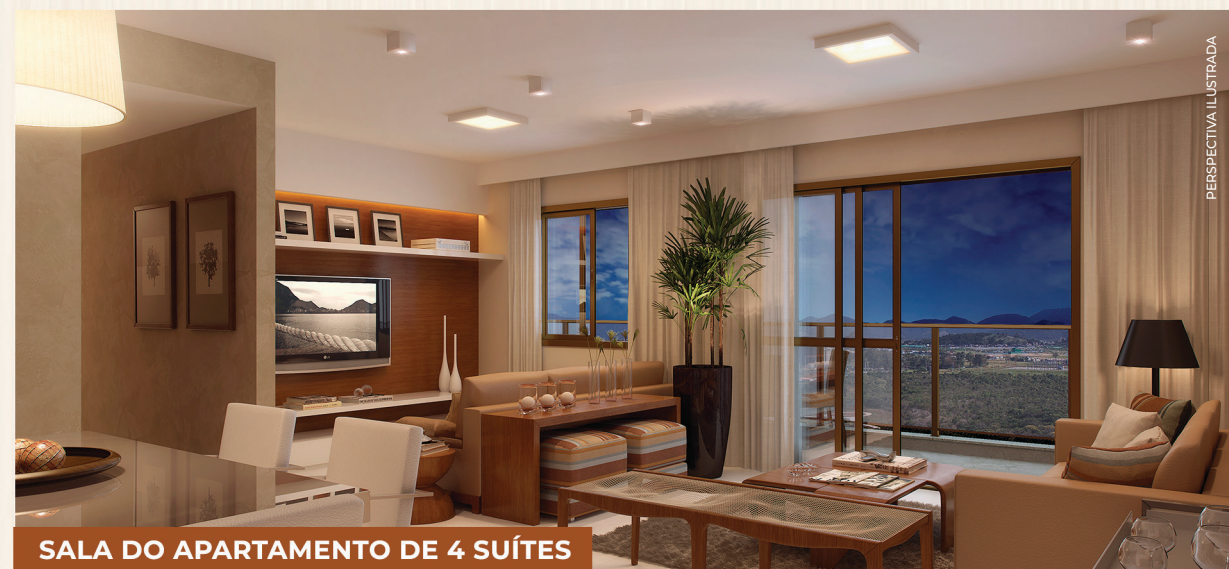
SALA DO APARTAMENTO DE 4 SUÍTES

Notas: Planta ilustrada com sugestão de decoração. Os móveis e equipamentos não são parte integrante do contrato. As cotas foram definidas pelos limites das paredes externas e pelas áreas das paredes internas entre as unidades podendo sofrer alterações na área de 5%. As plantas assinaladas na cor mais clara são semelhantes, variadas ou rotacionadas, podendo apresentar pequenas modificações. Os revestimentos internos das unidades serão executados conforme material descrito. Esta planta poderá sofrer alterações em dimensões, plantas e shafts, decoradas das posturas municipais, concessionárias, do local e no decorrer da obra. Churrasqueira e bancada da varanda, que juntos compõem o "Kit Churrasqueira", são itens opcionais oferecidos separadamente e disponibilizados de acordo com a legislação e edificação vigente.