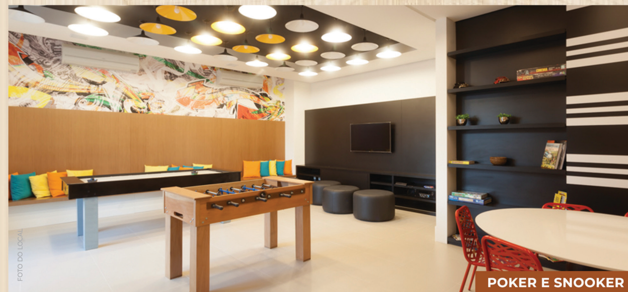
POKER E SNOOKER