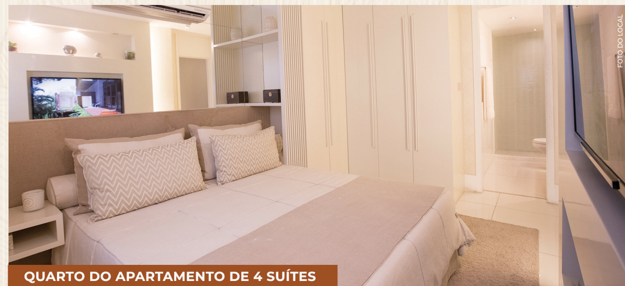
QUARTO DO APARTAMENTO DE 4 SUÍTES

Notas: Planta ilustrada com sugestão de decoração. Os móveis e equipamentos não são parte integrante do contrato. As cotas foram definidas pelos limites das paredes externas e pelas áreas das paredes internas entre as unidades podendo sofrer alterações na área de 5%. As plantas assinaladas na cor mais clara são semelhantes, variadas ou rotacionadas, podendo apresentar pequenas modificações. Os revestimentos internos das unidades serão executados conforme material descrito. Esta planta poderá sofrer alterações em dimensões, plantas e shafts, decoradas das posturas municipais, concessionárias, do local e no decorrer da obra. Churrasqueira e bancada da varanda, que juntos compõem o "Kit Churrasqueira", são itens opcionais oferecidos separadamente e disponibilizados de acordo com a legislação e edificação vigente.